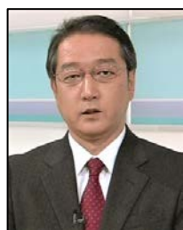
二宮 徹 NHK解説委員室 解説主幹