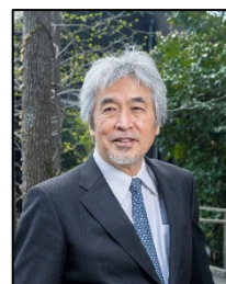
山極 壽一 総合地球環境学 研究所 所長