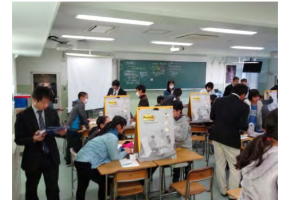
写真2 研究授業で生徒を見とる姿