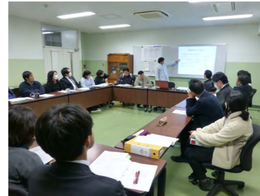
写真1 他教科の授業を皆で検討しあう姿